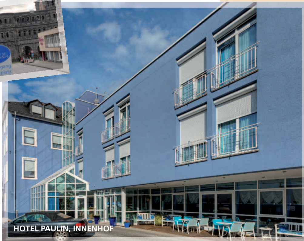
HOTEL PAULIN, INNENHOF