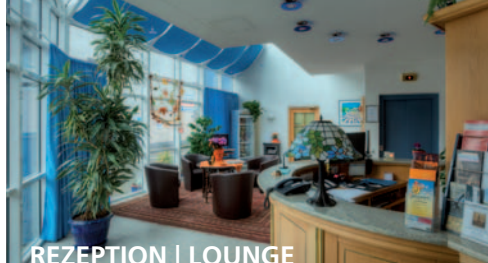
REZEPTION | LOUNGE

Inmitten Deutschlands ältester Stadt, im Schatten der Porta Nigra – nur wenige Gehminuten von weiteren Sehenswürdigkeiten wie Hauptmarkt, Dom und Steipe und den belebten Einkaufsstraßen der Altstadt entfernt – liegt das Familienhotel PAULIN. Zum Moselradweg ist man in 6 Minuten.